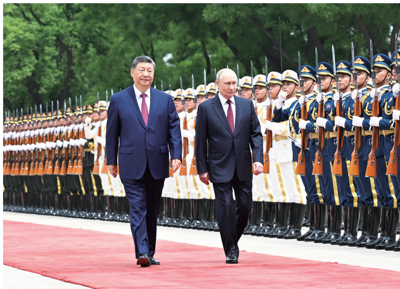
5月20日上午,国家主席习近平在北京人民大会堂同来华进行国事访问的俄罗斯总统普京举行会谈。会谈前,习近平在人民大会堂东门外广场为普京举行欢迎仪式。

新华社北京5月20日电(记者杨依军 温馨)5月20日上午,国家主席习近平在北京人民大会堂同来华进行国事访问的俄罗斯总统普京举行会谈。两国元首一致同意《中俄睦邻友好合作条约》继续延期。两国元首先后举行小范围、大范围会谈。