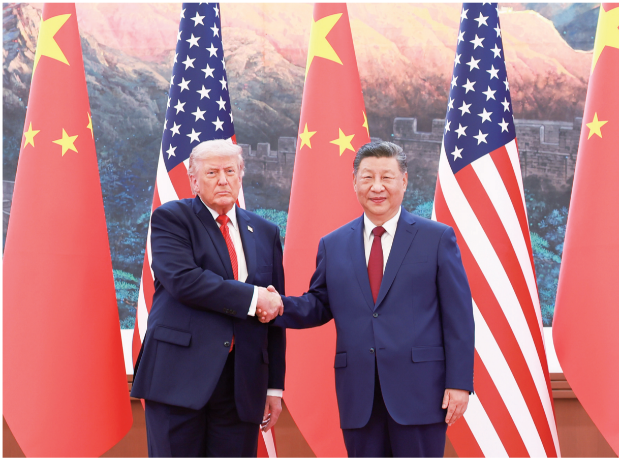
5月14日上午,国家主席习近平在北京人民大会堂同来华进行国事访问的美国总统特朗普举行会谈。