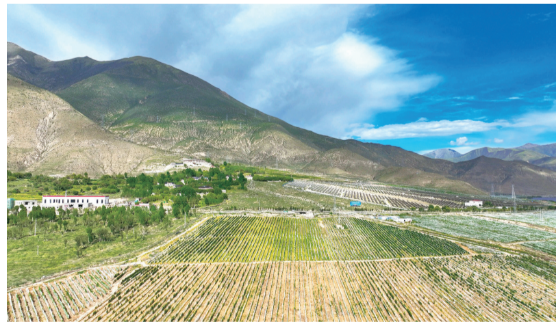
图为桑日县万亩葡萄基地航拍图。

绿色工业标杆:华新水泥的十年“蜕变之路” 几十年前,在桑日县的一片荒滩上,一座现代化水泥工厂拔地而起,持