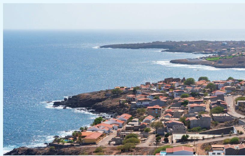
这是5月11日在佛得角圣地亚哥岛拍摄的旧城海滨景观。旧城是佛得角最早的聚落之一,曾为群岛首府。该地1462年以“大里贝拉”之名建立,18世纪末更名为“旧城”。2009年,“大里贝拉历史中心旧城”被列入联合国教科文组织世界遗产名录。

圣地亚哥岛位于佛得角群岛南部,大西洋海岸风光优美壮观。该岛是佛得角面积最大、人口最多的岛屿,首都普拉亚坐落于此。