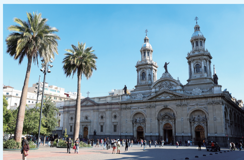
5月8日,人们在智利首都圣地亚哥的武器广场游玩。智利首都圣地亚哥位于智利中部,东依安第斯山脉,是智利最大城市,也是全国的政治、经济和文化中心。