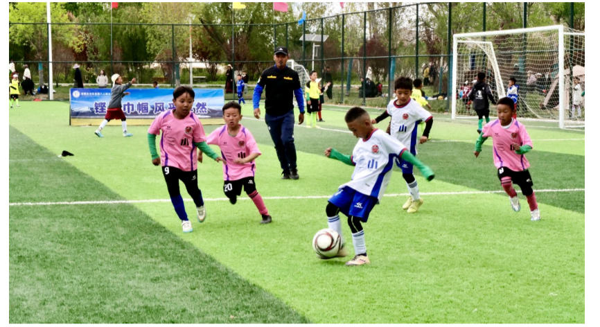
图为精彩的比赛现场。