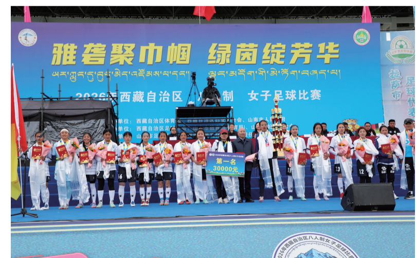
图为获得冠军的那曲市代表队合影留念。

春风轻拂着大地，绿茵场上激荡着巾帼豪情。4月22日下午，为期三天的西藏自治区八人制女子足球比赛在山南市体育场圆满落幕。来自山南市代表队、昌都市代表队、拉萨市代表队、日喀则市代表队、那曲市代表队及拉萨师范学院代表队6支代表队的姑娘们在赛场上奋力奔跑、逐梦绿茵，以坚韧不拔、顽强拼搏的姿态，赛出了风格、赛出了水平、赛出了友谊，用足球诠释了“巾帼不让须眉”的豪迈气概！