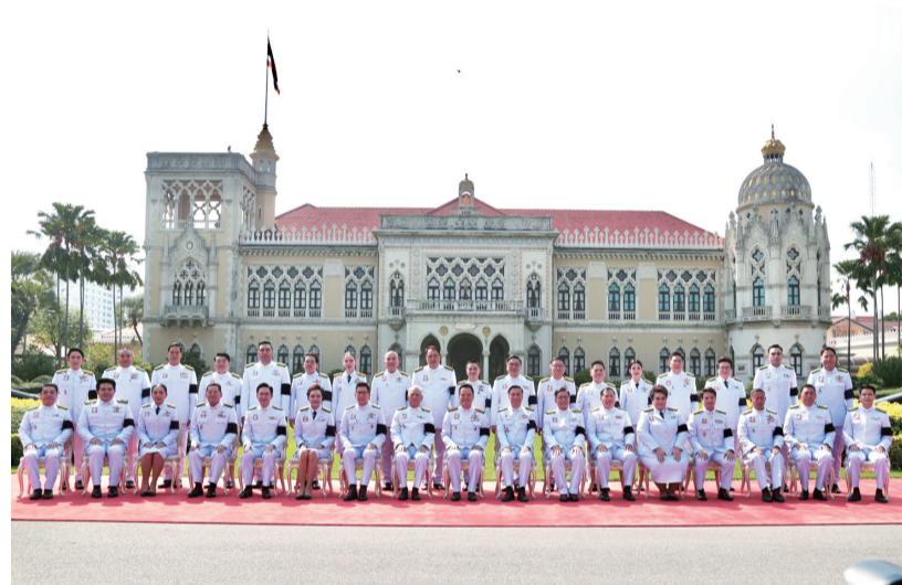
4月6日,泰国新一届内阁在曼谷的总理府合影。由阿努廷·参威拉军担任总理兼内政部长的泰国新一届内阁6日傍晚在曼谷律实官邸会见泰国国王玛哈·哇集拉隆功,在御前宣誓就职。