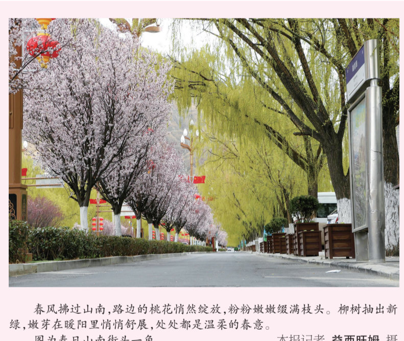
春风拂过山南,路边的桃花悄然绽放,粉嫩嫩缀满枝头。柳树抽出新绿,嫩芽在暖阳里悄悄舒展,处处都是温柔的春意。图为春日山南街头一角。

李富忠强调,要聚焦科学立法,以高质量制度供给夯实法治根基。突出立法重点,围绕重点领域推进“小快灵”“小切口”立法,持续将成熟经验制度化,保障重大改革、重点工作于法有据。提升立法质量,用好立法咨询专家与基层联系点,拓宽公众参与渠道,精准对接基层需求。强化立法监督,加强法规解释与适用指导,严格合法性、备案审查,科学编制各类规划。要聚焦严格执法,(下转第三版D)