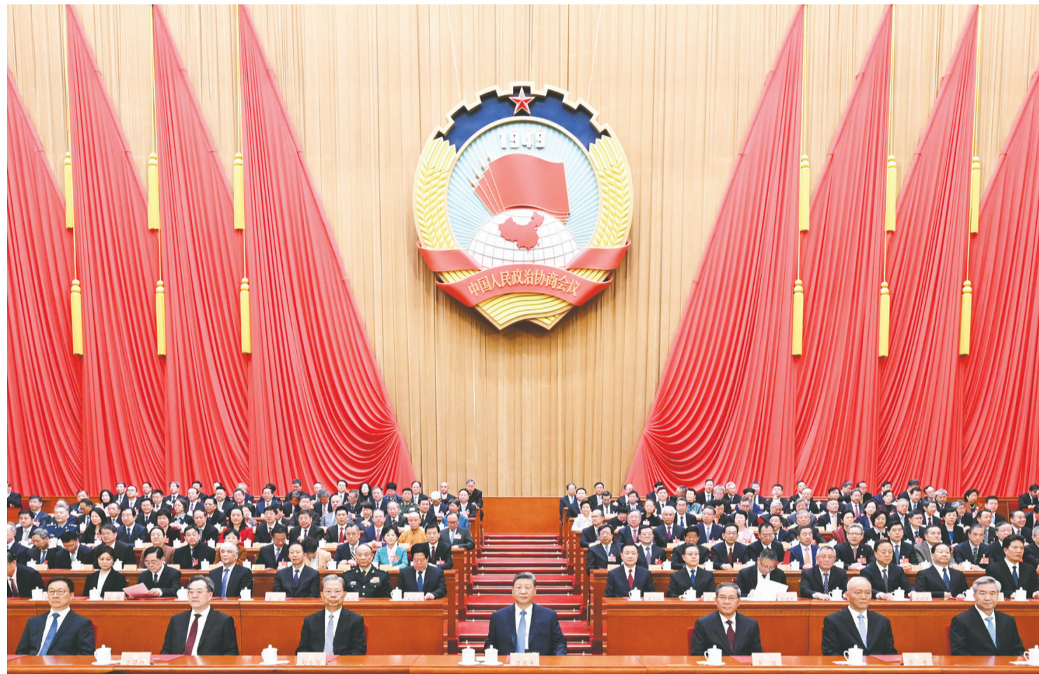
3月11日上午,中国人民政治协商会议第十四届全国委员会第四次会议在北京人民大会堂闭幕。这是习近平、李强、赵乐际、蔡奇、丁薛祥、李希、韩正在主席台就座。