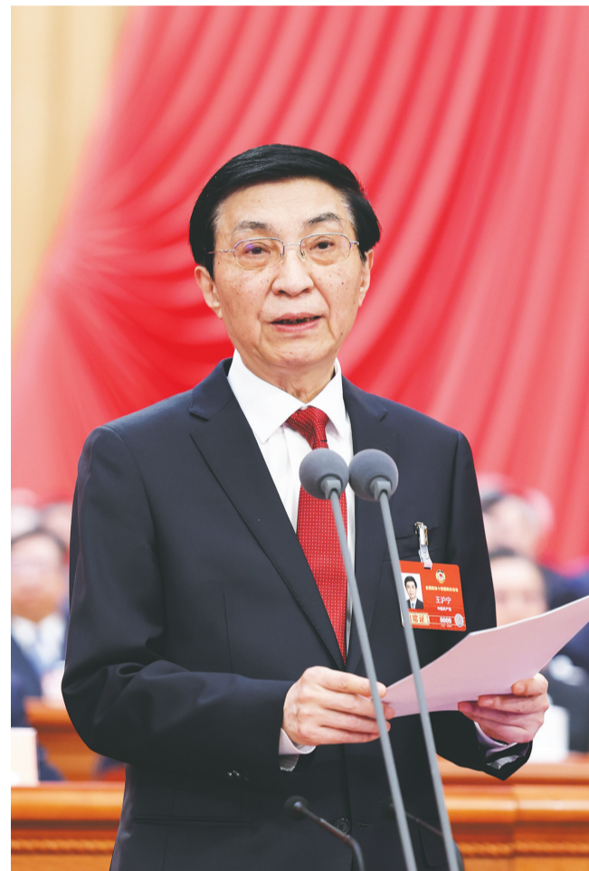
3月11日上午,中国人民政治协商会议第十四届全国委员会第四次会议在北京人民大会堂闭幕。全国政协主席王沪宁主持闭幕会并讲话。