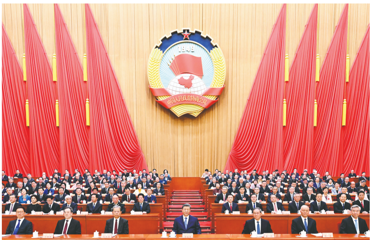
3月4日下午,中国人民政治协商会议第十四届全国委员会第四次会议在北京人民大会堂开幕。这是习近平、李强、赵乐际、蔡奇、丁薛祥、李希、韩正在主席台就座。

王沪宁表示,2025年是中国式现代化进程中具有重要意义的一年。面对错综复杂的国际形势和艰巨繁重的国内改革发展稳定任务,以习近平同志为核心的中共中央团结带领全党全国各族人民,迎难而上、奋力拼搏,统筹国内国际两