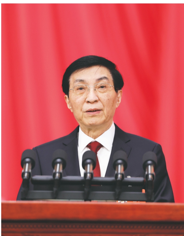
全国政协主席王沪宁代表政协第十四届全国委员会常务委员会,向大会报告工作。

作和政协协商制度,坚持人民政协性质定位,坚持团结和民主两大主题,坚持聚焦党和国家中心任务履职尽责,组织参加人民政协的各党派团体和各族各界人士,为实现“十五五”良好开局广泛凝聚人心、凝聚共识、凝聚智慧、凝聚力量。