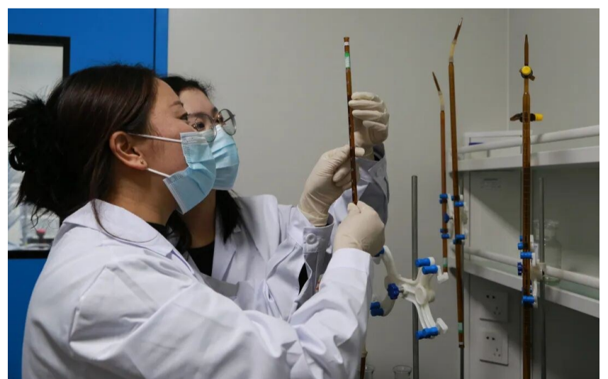
图为工作人员进行滴定操作。