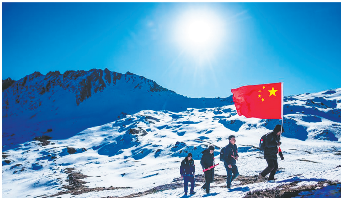
冬日时节,西藏山南市隆子县玉麦乡的群山覆盖着积雪。护边员们行进在雪山密林间,他们沿着卓嘎、央宗姐妹走过的路,日复一日在雪域边陲巡逻护边,传承着老一輩的守边精神,用双脚丈量国土,用忠诚守护家园。 ▲护边员们行进在雪山间。 ▲护边员们在丛林里巡逻。