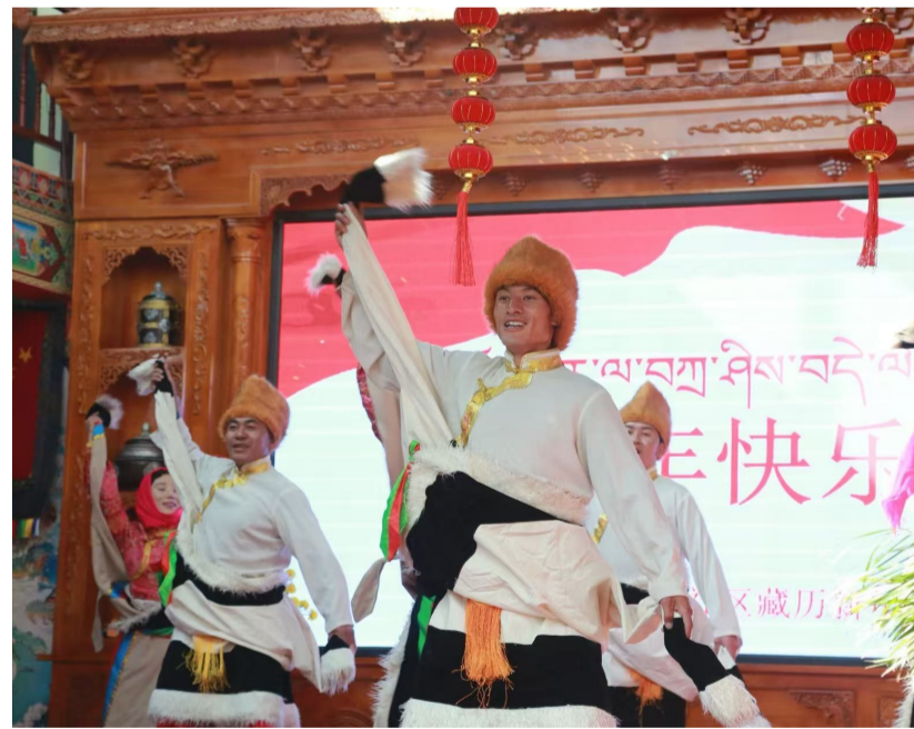
图为文艺活动现场。