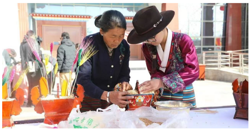
图为小朋友和家人一起制作切玛。