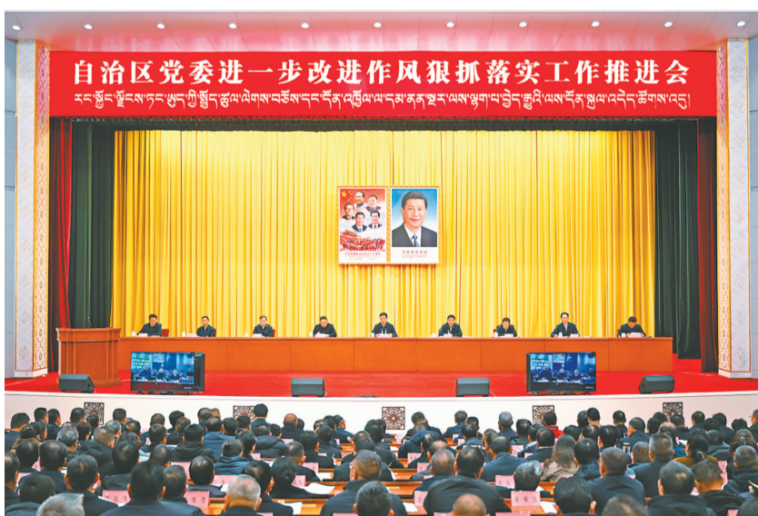
1月5日,自治区党委进一步改进作风狠抓落实工作推进会在拉萨召开。这是会议现场。

西藏日报拉萨1月5日讯 (记者刘文涛 张黎黎)1月5日,自治区党委进一步改进作风狠抓落实工作推进会在拉萨召开。自治区党委书记王君正出席并讲话。他强调,要认真贯彻落实习近平总书记关于加强党的作风建设、西藏工作的重要指示和新时代党的治藏方略,深入改进工作作风,优化完善落实机制,不断推进作风建设常态化长效