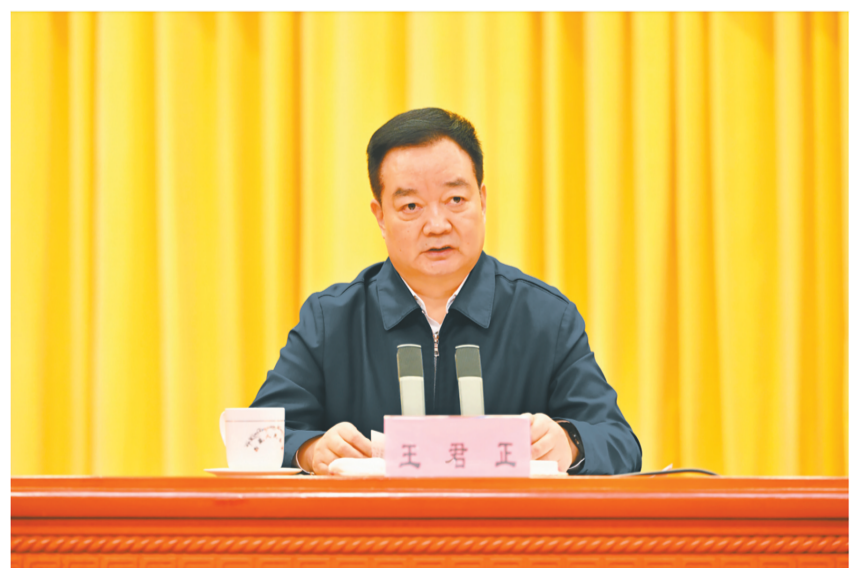
1月5日,自治区党委进一步改进作风狠抓落实工作推进会在拉萨召开。自治区党委书记王君正出席并讲话。西藏日报记者 旦增西巴 摄