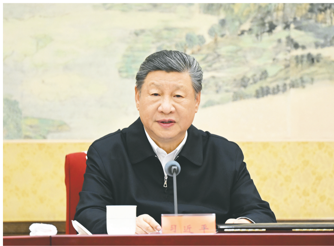
12月25日至26日,中共中央政治局召开民主生活会,中共中央总书记习近平主持会议并发表重要讲话。