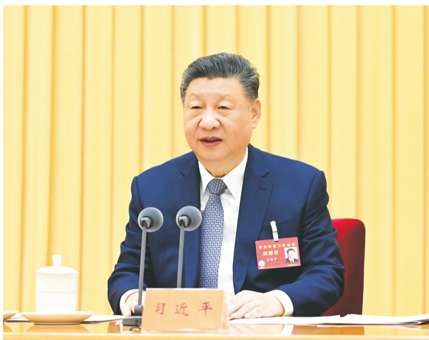
12月10日至11日，中央经济工作会议在北京举行。中共中央总书记、国家主席、中央军委主席习近平出席会议并发表重要讲话。

会议指出，明年经济工作在政策取向上，要坚持稳中求进、提质增效，发挥存量政策和增量政策集成效应，加大逆周期和跨周期调节力度，提升宏观经济治理效能。要继续实施更加积极的财政政策，保持必要的财政赤字、债务总规模和支出总量，加强财政科学管理，优化财政支出结构，规范税收优惠、财政补贴政策。重视解决地方财政困难，兜牢基层“三保”底线，严肃财经纪律，坚持党政机关过紧日子。要继续实施适度宽松的货币政策，把促进经济稳定增长、物价合理回升作为货币政策的重要考量，灵活高效运用降准降息等多种政策工具，保持流动性充裕，畅通货币政策传导机制，引导金融机构加大对扩内需、科技创新、中小微企业等重点领域。保持人民币汇率在合理均衡水平上的基本稳定。要增强宏观政策取向一致性和有效性。将各类经济政策和非经济政策、存量政策和增量政策纳入宏观政策取向一致性评估。健全预期管理机制，提振社会信心。