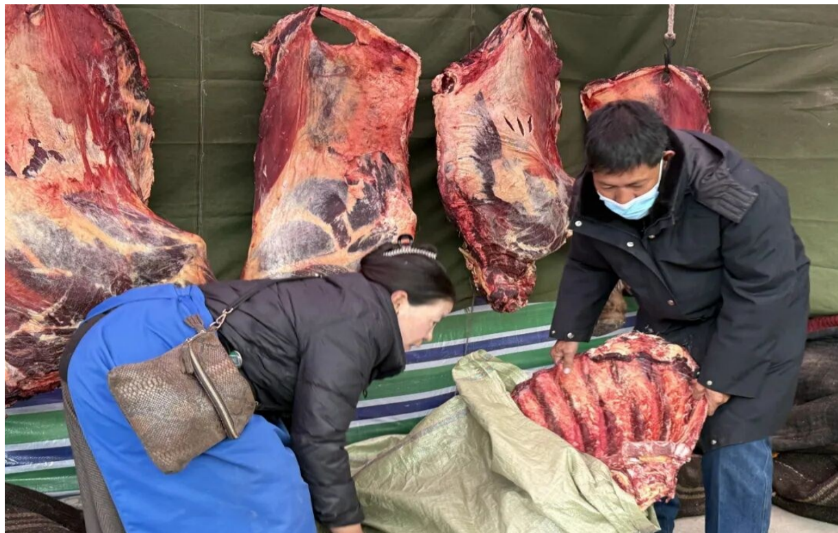
图为商户正准备包装称重牦牛肉。

除了热销的牛羊肉，奶渣、酥油、核桃、辣椒等特色农畜产品也备受顾客青睐，成为市民游客的“必买清单”。在措美县哲古镇扎西边的摊位前，几位游客正围着奶渣块仔细端