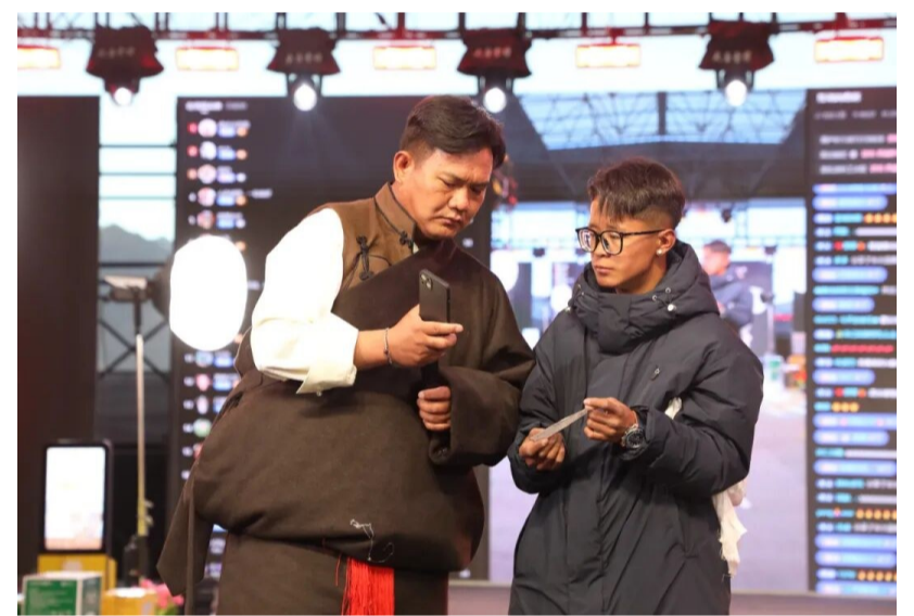
图为“西藏胖哥”正在同网友连线。