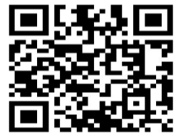
扫码查看“视觉周刊”