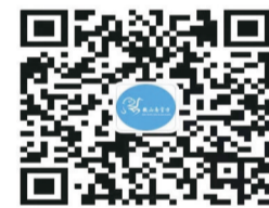
扫码关注“微山南官方”