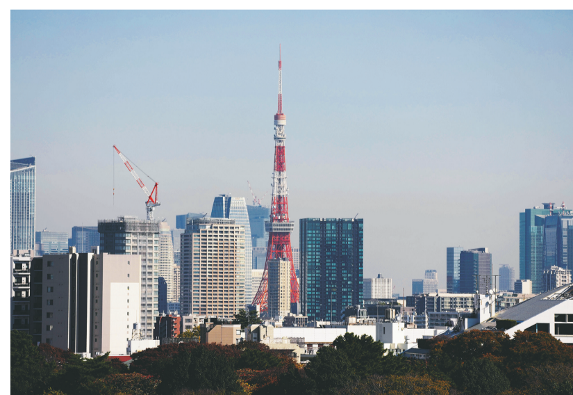
这是11月17日拍摄的日本东京城市景观。日本内阁府17日发布的初步统计结果显示,日本三季度实际国内生产总值(GDP)按年率计算下降1.8%。

智利法律规定,总统选举中得票率超过50%的候选人直接胜出,若无候选人在第一轮投票中获得超过50%选票,哈拉和卡斯蒂涅拉将进入第二轮投票,得票最多的两人将进入第二轮投票,得票多者当选总统。智利总统任期4年,不可连选连任。