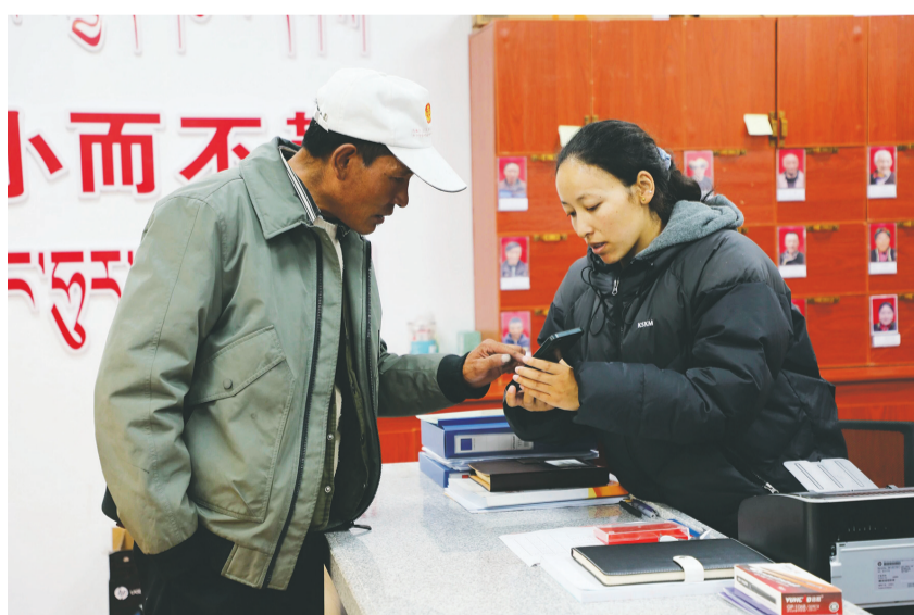
图为驻村工作队队员耐心解答群众疑惑。