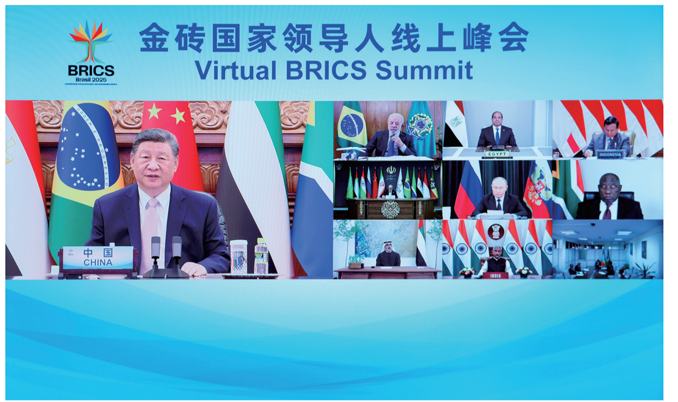
9月8日晚，国家主席习近平出席金砖国家领导人线上峰会，并发表题为《团结合作 砥砺前行》的重要讲话。

新华社北京9月8日电（记者杨依军 邵艺博）9月8日晚，国家主席习近平出席金砖国家领导人线上峰会，并发表题为《团结合作 砥砺前行》的重要讲话。