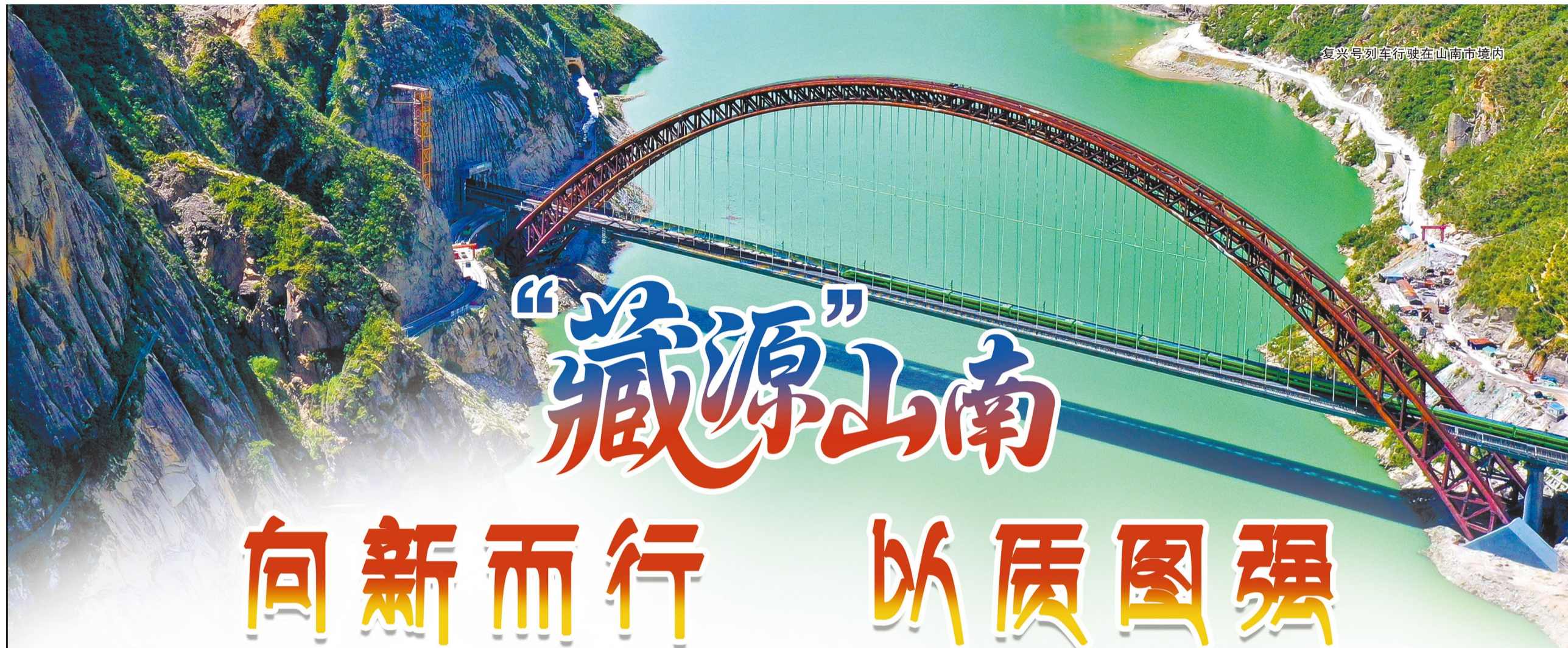
复兴号列车行驶在山南市境内