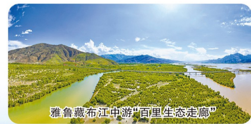
雅鲁藏布江中游“百里生态走廊”

不仅如此,山南市坚持走“生态产业化、产业生态化”路子,力争让老百姓享受绿色福祉。“百里生态走廊”、“百亿产业走廊”和3个“万亩生态产业”,助力山南构筑生态安全屏障,建设生态文明高地,厚植绿色基底,实现“增绿又增收”。