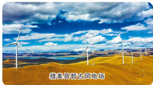
措美县哲古风电场

山南市位于西藏自治区南部,古称“雅砻”,因雅砻河而得名,被认为是藏民族的摇篮和藏文化的发祥地之一。多年来,山南市全面贯彻新时代党的治藏方略,立足新发展阶段,完整准确全面贯彻新发展理念,统筹发展与生态保护。通过产业升级和营商环境优化,大力发展清洁能源、特色农牧和文旅旅游等产业,因地制宜发展新质生产力;坚持生态优先、绿色发展,推进山水林田湖草沙系统治理;加强文化遗产保护传承,让优秀传统文化焕发新生机……这片高原沃土,正以开放创新的姿态,在建设社会主义现代化新西藏征程上阔步前行。