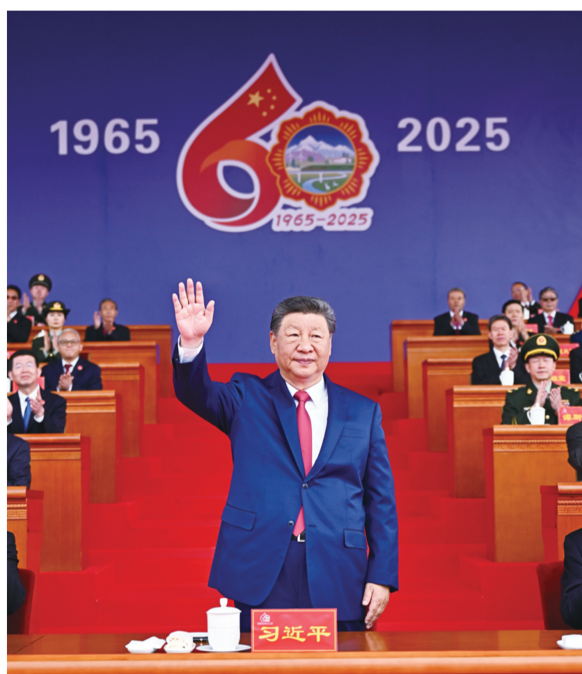
8月21日上午，西藏各族各界干部群众约2万人欢聚拉萨市布达拉宫广场，热烈庆祝西藏自治区成立60周年。中共中央总书记、国家主席、中央军委主席习近平出席庆祝大会。