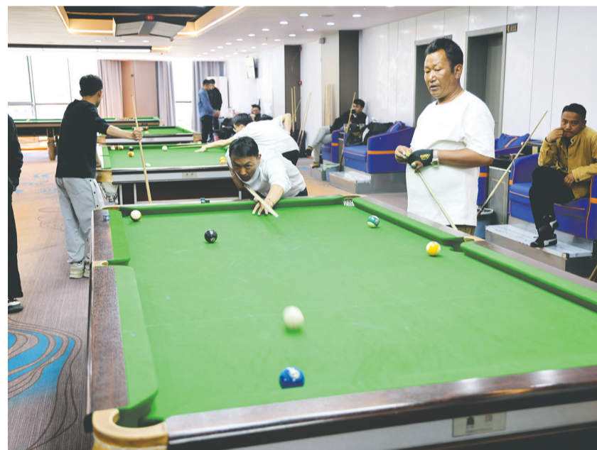
7月10日,由浪卡子县委宣传部、县新时代文明实践中心联合承办的庆祝西藏自治区成立60周年暨全民运动会台球比赛火热开赛。赛事设置了男子斯诺克与女子中式黑八两大项目。图为参赛选手们全神贯注参与比拼。

夕阳镀亮牛棚最后一颗铁钉,归鸟掠过湿地鎏金般的天际。奶牛颈铃的清脆、农机轰鸣的雄浑、折嘎传唱的悠扬,在下洛村奏响庆祝西藏自治区成立60周年的动人乐章。党旗映红的土地上,蓝天、白云、绿草、湿地、牛群共绘生态与产业融合的壮美图景。乡村振兴的新征程,正乘着时代东风,昂扬启航!