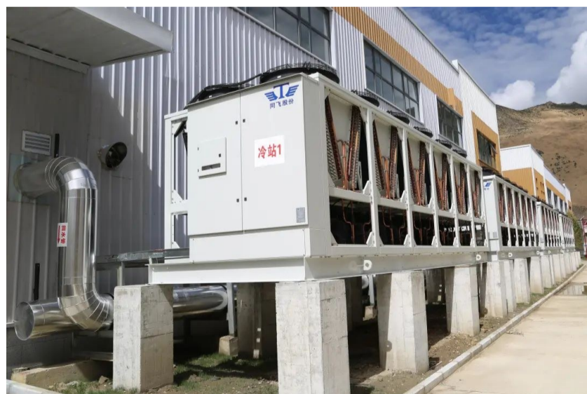
图为同飞股份的冷站设备(冷站1)。