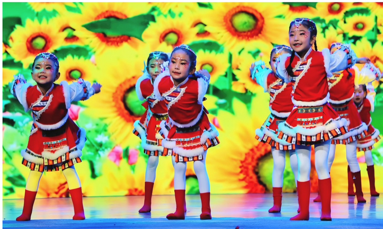
图为小朋友们表演节目。