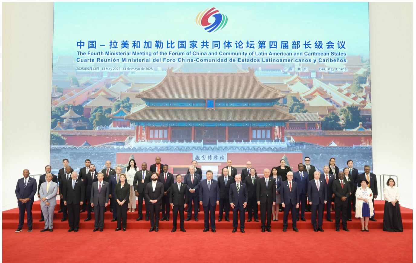
5月13日上午,国家主席习近平在北京国家会议中心出席中国—拉美和加勒比国家共同体论坛第四届部长级会议开幕式并发表主旨讲话。这是习近平同与会嘉宾集体合影。