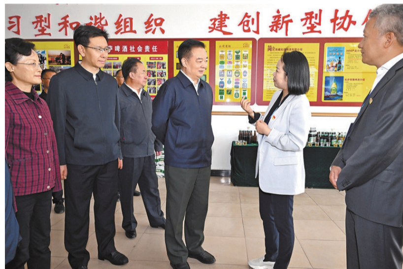
23日上午,自治区党委书记王君正前往民营企业和自治区工商联调研,并主持召开民营企业座谈会。这是王君正在西藏拉萨啤酒有限公司详细了解企业生产经营、设计研发、市场拓展等情况。