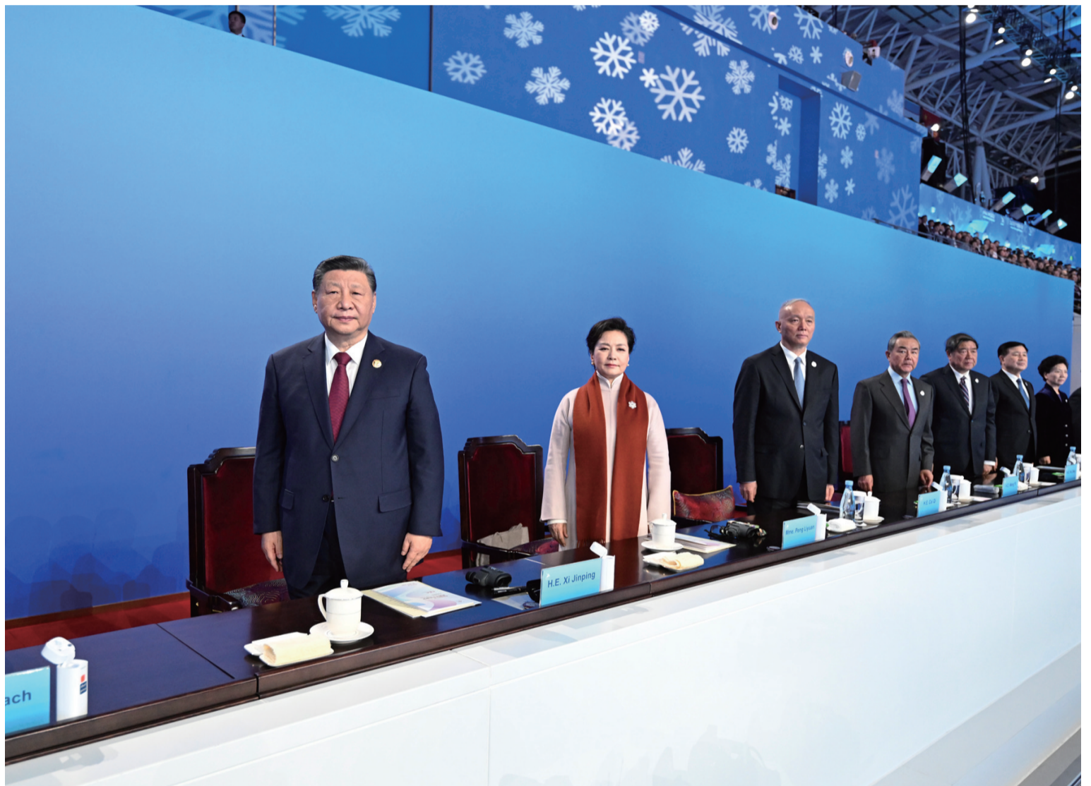
2月7日晚,第九届亚洲冬季运动会在黑龙江省哈尔滨市隆重开幕。习近平等党和国家领导人出席开幕式。