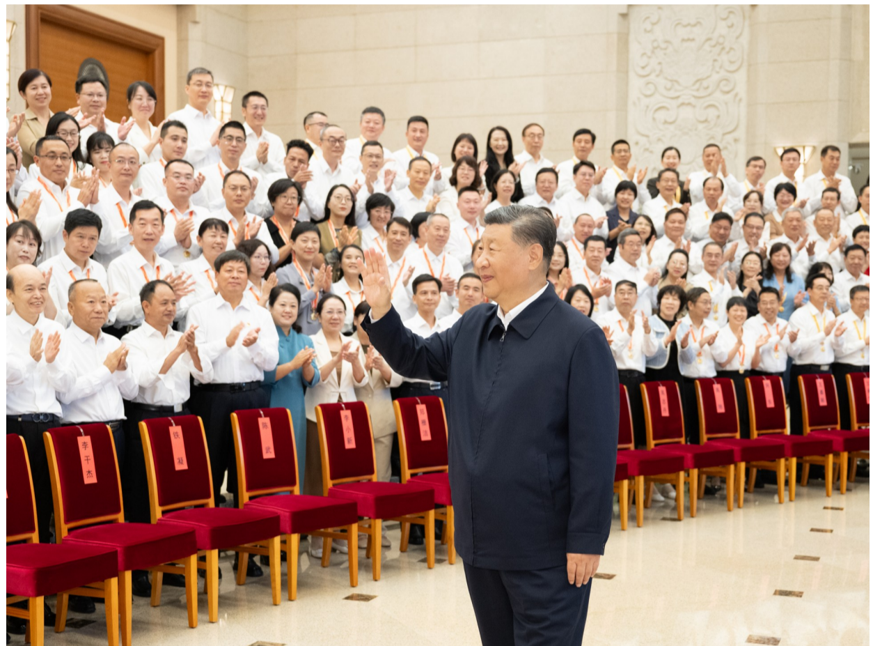
九月九日,党和国家领导人习近平、李强、蔡奇、丁薛祥等在北京接见参加庆祝第四十个教师节暨全国教育系统先进集体和先进个人表彰活动代表。

新华社北京9月10日电 全国教育大会9日至10日在北京召开。中共中央总书记、国家主席、中央军委主席习近平出席会议并发表重要讲话。他强调,建成教育强国是近代以来中华民族梦寐以求的美好愿望,是实现以中国式现代化全面推进强国建设、民族复兴伟业的先导任务、坚实基础、战略支撑,必须朝着既定目标扎实迈进。