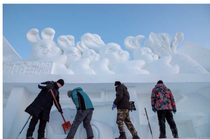
12月11日,工作人员在太阳岛雪博会园区制作雪雕。目前,哈尔滨市第35届太阳岛雪博会正全力推进雪雕作品雕刻作业。园区内大部分雪块已经开铲,部分作品已完成雕刻。本届太阳岛雪博会以“冰雪之都 梦雪奇缘”为主题,将以大型雪雕作品为艺术载体,打造六大核心体验区及三大氛围拓展区的景观布局。