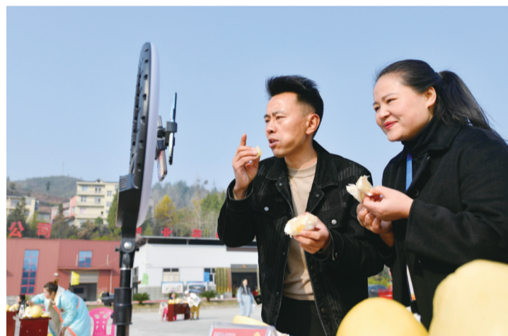
12月12日,网络主播在恩恩县沙道沟镇杆杆村参加贡水白柚线上直播销售擂台赛。当地邀请网络主播举办线上直播销售擂台赛,助力贡水白柚外销。

张伯礼:国务院联防联控机制“新十条”的发布,让有乡愁的人们有了回家过年的盼头。团圆是中国人对春节最大的期盼,将心比心,将疫情防控工作与暖心服务更好地结合起来,也是我国疫情防控政策优化调整的方向。在疫情新形势下,相信疫情防控部门和各地政府也都未雨绸缪,因地制宜制定返乡政策,今年大概率是个团圆年。但春运人员迁徙传播风险较高,相关准备工作仍需加强,个人防护意识和措施切不可放松。