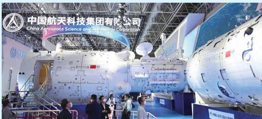
中国空间站组合体1:1展示首次亮相珠海中国航展,观众在参观中国空间站组合体展示舱。

实施方案结合建材行业实际情况提出了“十四五”“十五五”两个阶段的主要目标。“十四五”期间,水泥、玻璃、陶瓷等重点产品单位能耗、碳排放强度不断下降,水泥熟料单位产品综合能耗降低3%以上。“十五五”期间,建材行业绿色低碳关键技术产业化实现重大突破,原燃料替代水平大幅提高,基本建立绿色低碳循环发展的产业体系。