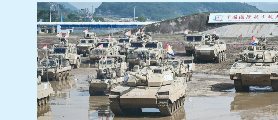
中国航展上,中国兵器工业集团等企业为观众带来了震撼的地面装备动态展示。