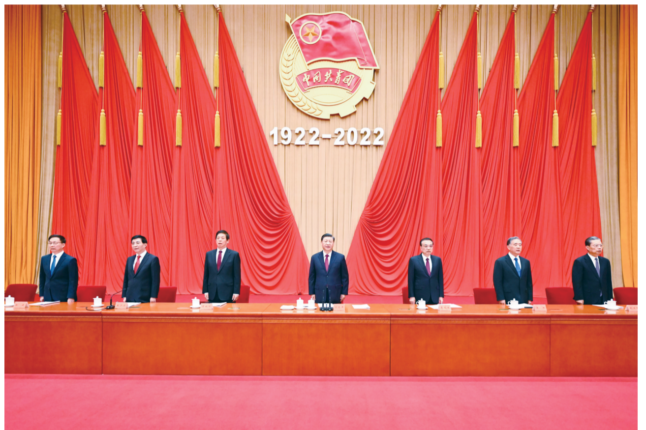
5月10日，庆祝中国共产主义青年团成立100周年大会在北京人民大会堂隆重举行。习近平、李克强、栗战书、汪洋、王沪宁、赵乐际、韩正等出席大会。

新华社北京5月10日电 庆祝中国共产主义青年团成立100周年大会10日上午在北京人民大会堂隆重举行。中共中央总书记、国家主席、中央军委主席习近平在会上发表重要讲话，青春孕育无限希望，青年创造美好明天。新时代的中国青年，生逢其时、重任在肩，施展才干的舞台无比广阔，实现梦想的前景无比光明。实现中国梦是一场历史接力赛，当代青年要在实现民族复兴的赛道上奋勇争先。共青团要牢牢把握培养社会主义建设者和接班人的根本任务，坚持为党育人、自觉担当尽责、心系广大青年、勇于自我革命，团结带领广大团员青年成长为有理想、敢担当、能吃苦、肯奋斗的新时代好青年，用青春的能动力和创造力激荡起民族复兴的澎湃春潮，用青春的智慧和汗水打拼出一个更加美好的中国。