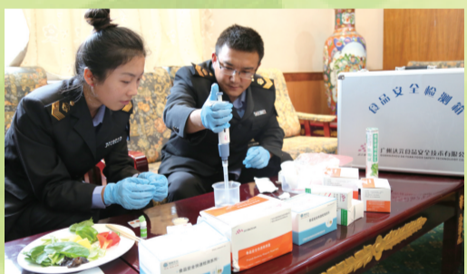
图为食药监局工作人员正在进行食品抽样检查。

湖南党政代表团一名成员,观看节目期间,突然出现了胸闷、呼吸不畅等症状。在场保健组急忙给予紧急处理,待情况稍有稳定,立刻联系场外急救组将该成员送往人民医院进行进一步