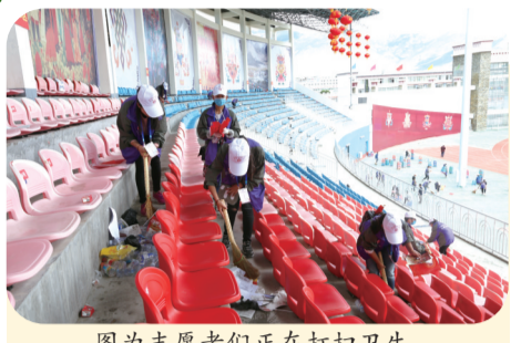
图为志愿者们正在打扫卫生。

8月15日,天朗气清,市体育场高朋满座。山南迎来了撤地设市后的第一个雅砻文化节。 这样盛大的日子,保障所有人员的安全,不容有失。为此,组委会周密安排、精心部署,成立多个小组,从卫生、安保、志愿服务和后勤保障多方位为雅砻文化节的圆满举办提供保障。 让我们走进会场,去探访那些默默坚守的幕后工作人员。