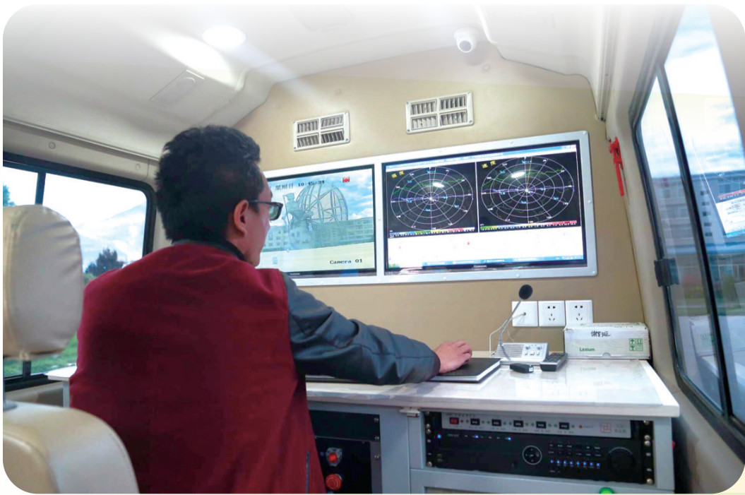
图为气象局工作人员在雷达车内作业。

“今天天气很阴沉,看样子要下雨了,开幕式应该会推迟吧,我们还要不要进去?”8月15日,在2016年中国西藏雅砻文化节开幕当天一大早,许多群众发出了这样的疑问。